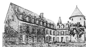
Château du Theil

Par la suite, il devient une résidence familiale.