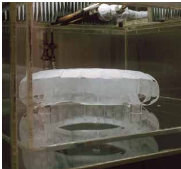
Cristal Liquide – (détail du mazzocchio mis en sublimation) – 1982 Collection FRAC-Aquitaine

« Un arc est depuis des années dessiné et tendu dans l'œuvre de Jean Sabrier; ou bien construit, par pliage, collage, découpage: objet d'une industrie minutieuse, images stéréoscopiques (accompagnées de lunettes conçues par l'artiste afin d'en obtenir le relief). On pourrait y voir le souci d'un enfant horloger qui démonte des pendules, des montres de gousset pour étaler sur sa table les tripes, ressorts, rouages qui égrènent, fastidieusement, les minutes et les heures, pour en recomposer quelque monstre inerte dans lequel le tic-tac obsédant du temps n'est plus sensible que par le poids, allégé par le souvenir de l'ancien mécanisme, d'une chose qui a perdu son usage: une forme pure, non un hasard mais une construction.